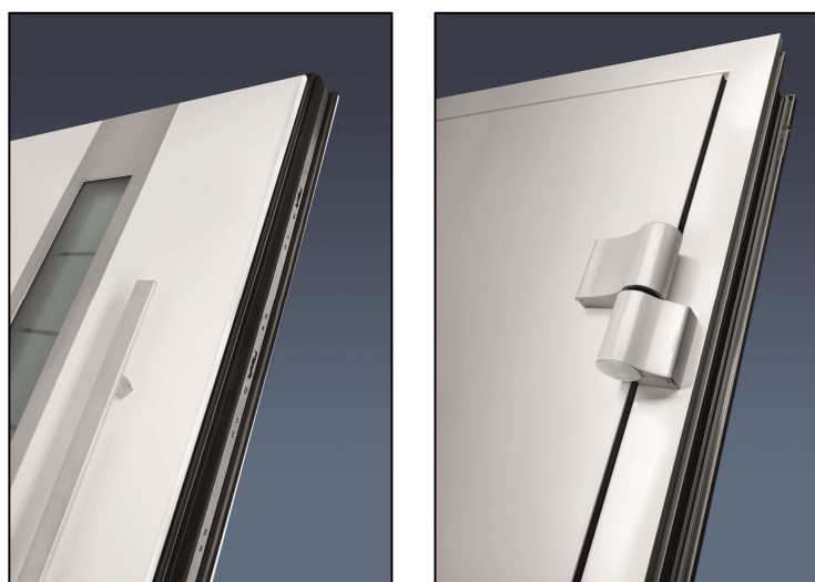
Рис. 3: Благодаря установленному заподлицо с внешней и внутренней стороны дверному полотну с расположенным внутри профилем створки входные двери выглядят с внешней стороны намного больше, а с внутренней стороны хорошо сочетаются с межкомнатными дверьми дома.

Рис 2: 100 мм строительная глубина дверного полотна для новой входной двери ThermoCarbon позволяет использовать новые тенденции дизайна с трехмерными ручками.